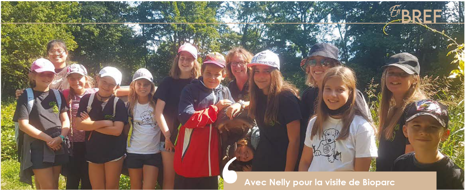
Avec Nelly pour la visite de Bioparc

différents. Les lémuriens ont bien plu aux jeunes, mais les perroquets qui rigolent ne les ont pas laissés indifférents !