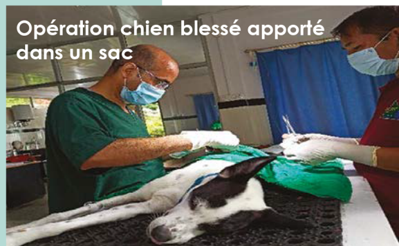
Opération chien blessé apporté dans un sac