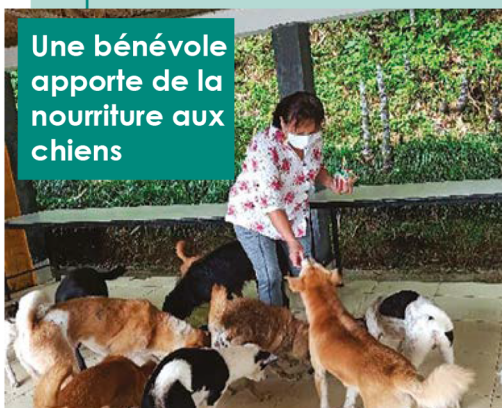
Une bénévole apporte de la nourriture aux chiens