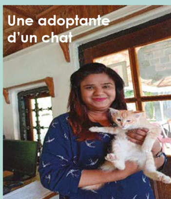
Une adoptante d'un chat