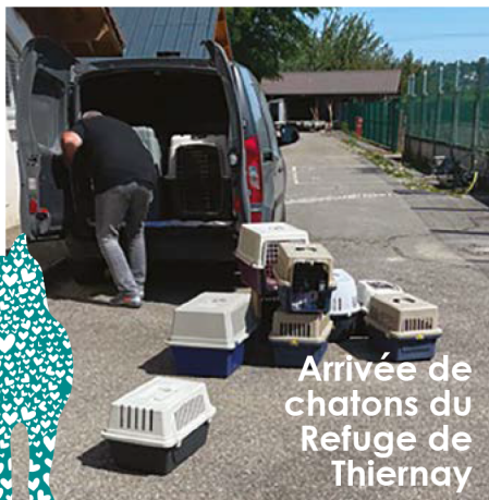
Arrivée de chatons du Refuge de Thiernay