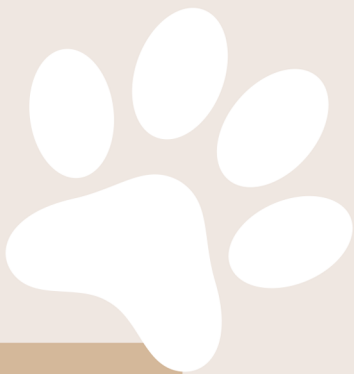
Visite de la SPA de Savoie