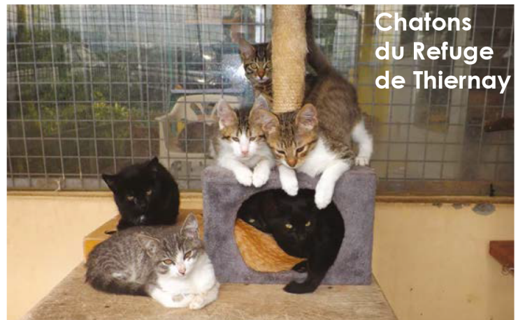
Chatons du Refuge de Thiernay