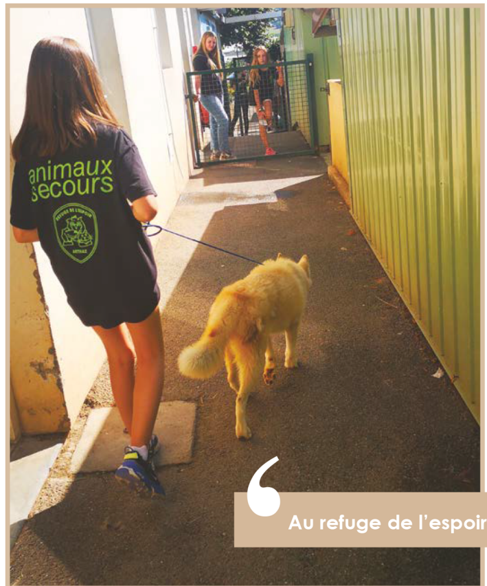
Au refuge de l'espoir

Des partages et de nouvelles connaissances ont fait la richesse de ce mois d'août. Avec ou sans soleil, ce fut de belles vacances avec les JAA. Ils ont repris les études, mais on ne doute pas de les revoir prochainement au Refuge de l'Espoir à Arthaz.